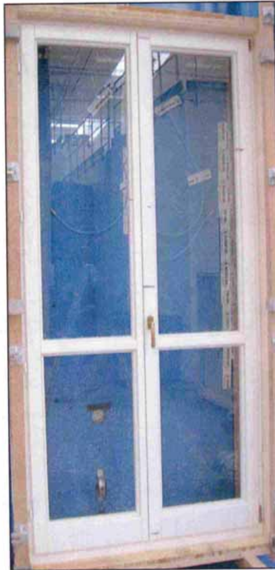
Figura 1: Fotografie del campione in prova